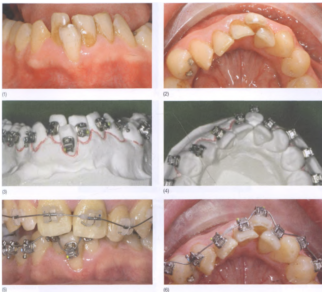
Рис. 12.4. 42-летний пациент со скученностью нижних резцов и узкой и тонкой полосой кератинизированной десны в области зуба 41. Было решено проверить реакцию мягких тканей на ортодонтическое лечение с расширением зубной дуги и протрузией резцов. Начато лечение без удаления с использованием самолигирующих брекетов с низким трением и суперэластичных проволочных дуг; увеличения десневой полосы не потребовалось: (1, 2) до лечения; (3, 4) диагностические модели челюстей пациента с зафиксированными брекетами; (5-6) во время посещения для фиксации

у которых в какой-то момент их жизни образуются щели между передними зубами в результате их протрузии, с или без наличия деформированных зубных рядов и/или глубокого прикуса (рис. 12.5).